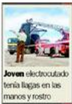
Joven electrocutado tenía llagas en las manos y rostro